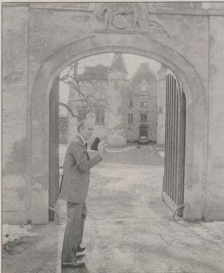
CHANONAT (PUY-DE-DÔME), LE 4 MARS 1973. Valéry Giscard d'Estaing pose devant la demeure de famille à l'occasion des élections législatives.