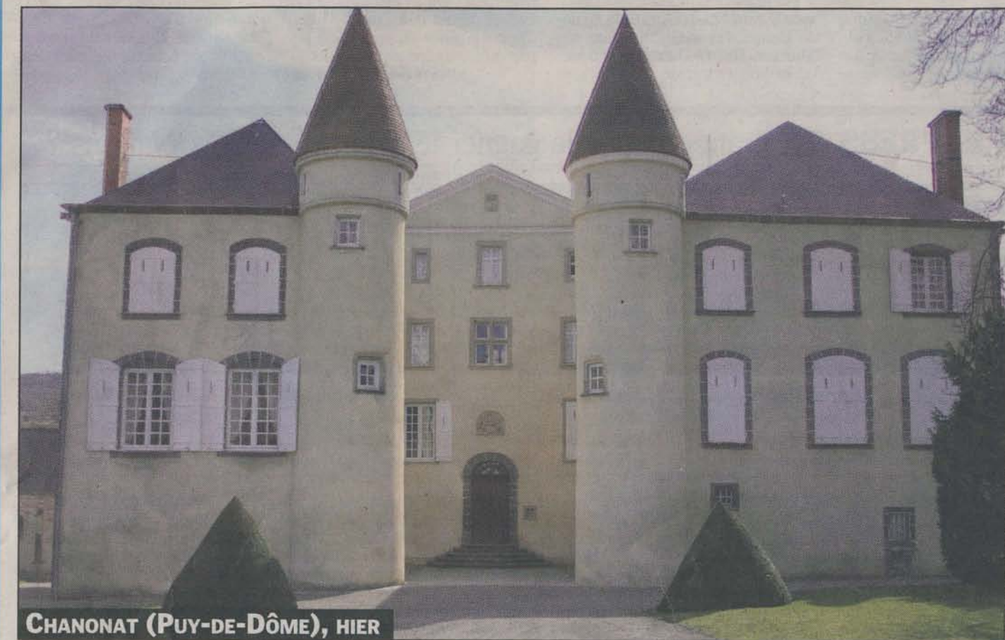
CHANONAT (PUY-DE-DÔME), HIER

TOURNOI DES SIX NATIONS. Le XV de France n'aura pas la tâche facile à Cardiff face à une équipe galloise qui a réussi jusqu'à présent un sans-faute. PAGES 2 ET 3