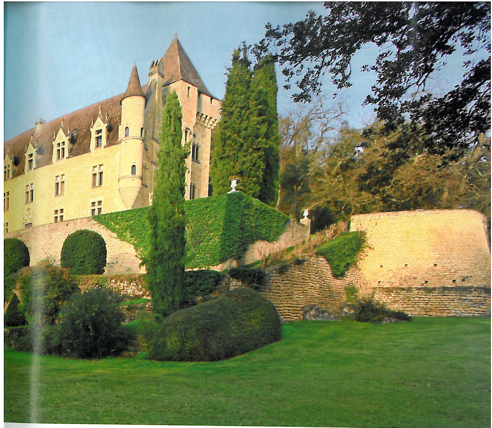
EN POSITION DOMINANTE, FACE À SES TERRASSES SUCCESSIVES, CE BIEN OFFRE 1000 M 2 DE SURFACE HABITABLE. OVERLOOKING ITS SUCCESSIVE TERRACES, THE PROPERTY OFFERS 1,000 SQ.M OF LIVING SPACE.